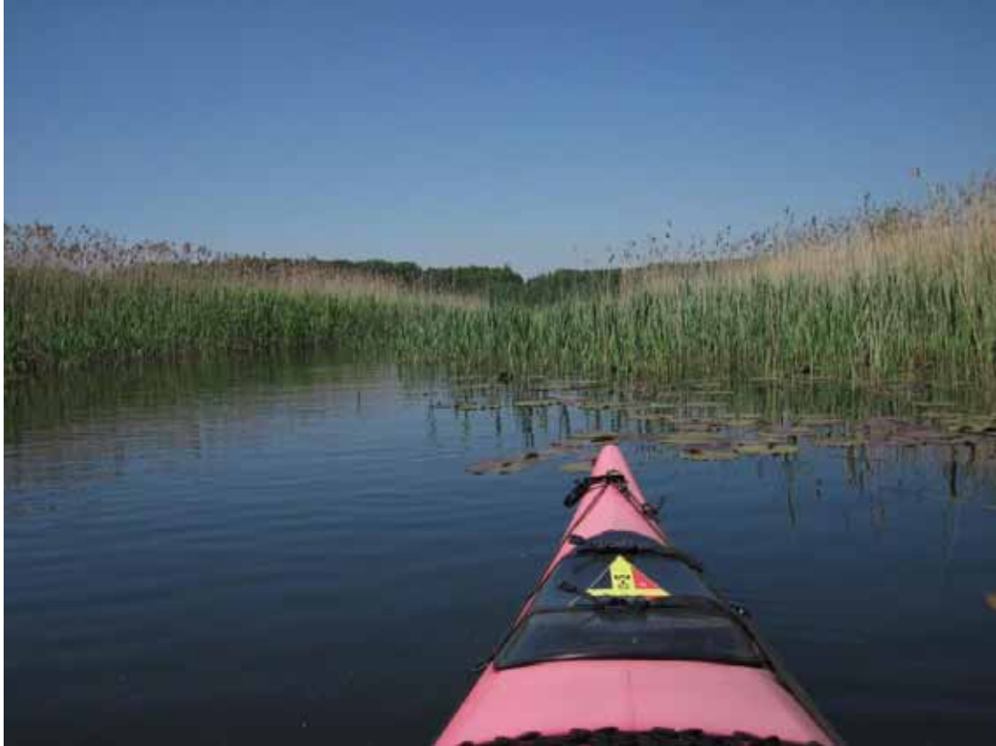
Zwischen Woterfitz- und Carpsee