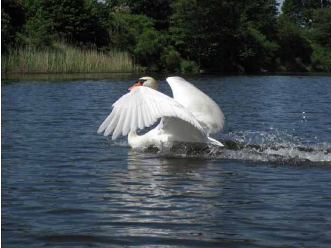
Auf der Havel bei Ahrensberg