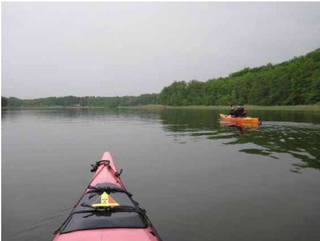
Fahrt von Strasen nach Rheinsberg

Der Urlaub ging wie immer in Mecklenburg viel zu schnell vorbei, und wir waren bestimmt nicht zum letzten Mal in Strasen.