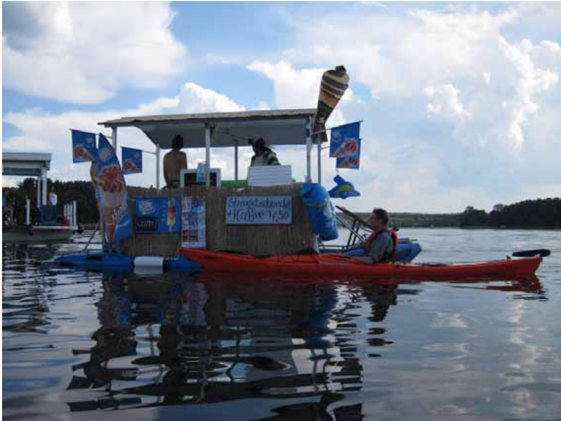
Eishändler bei Strasen – das neue Geschäftsmodell einiger Jugendlicher