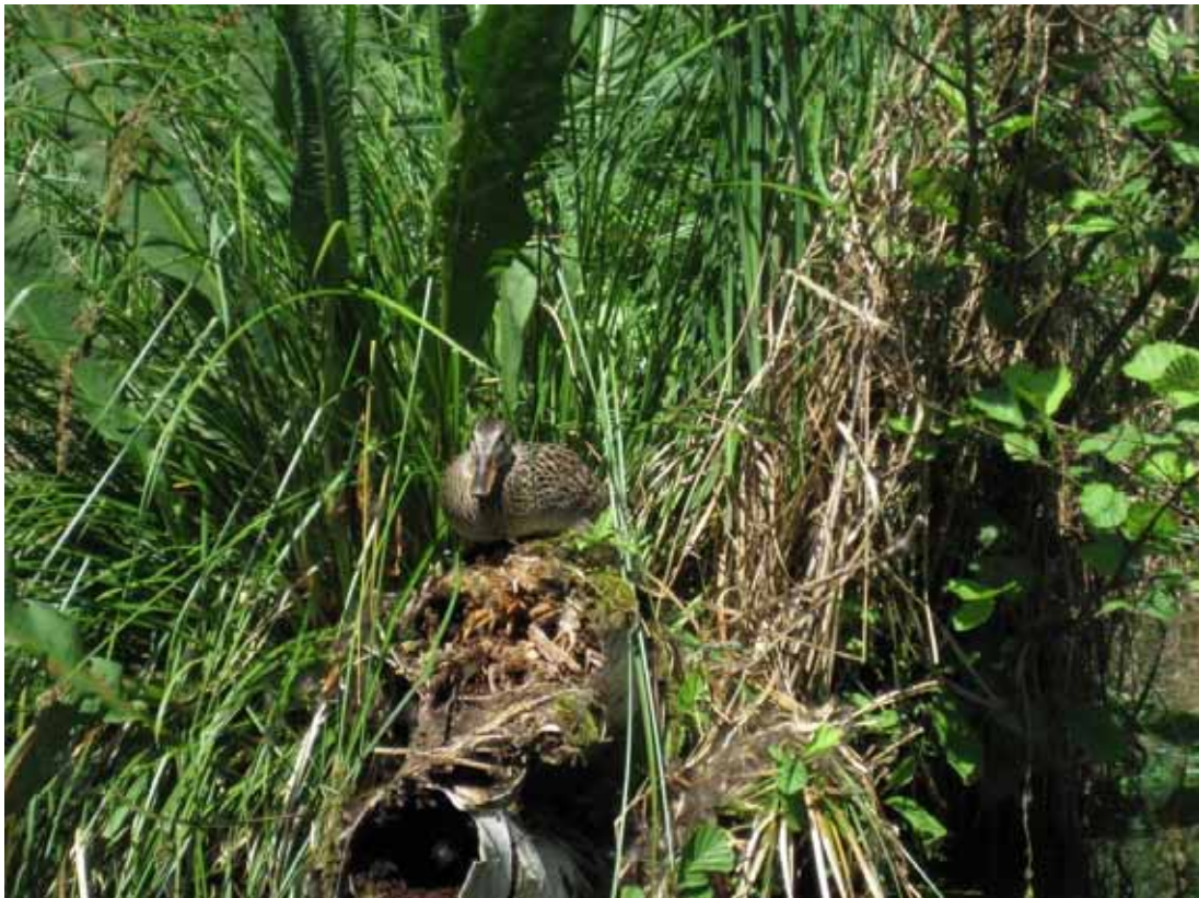
Zwischen Woterfitz- und Carpsee