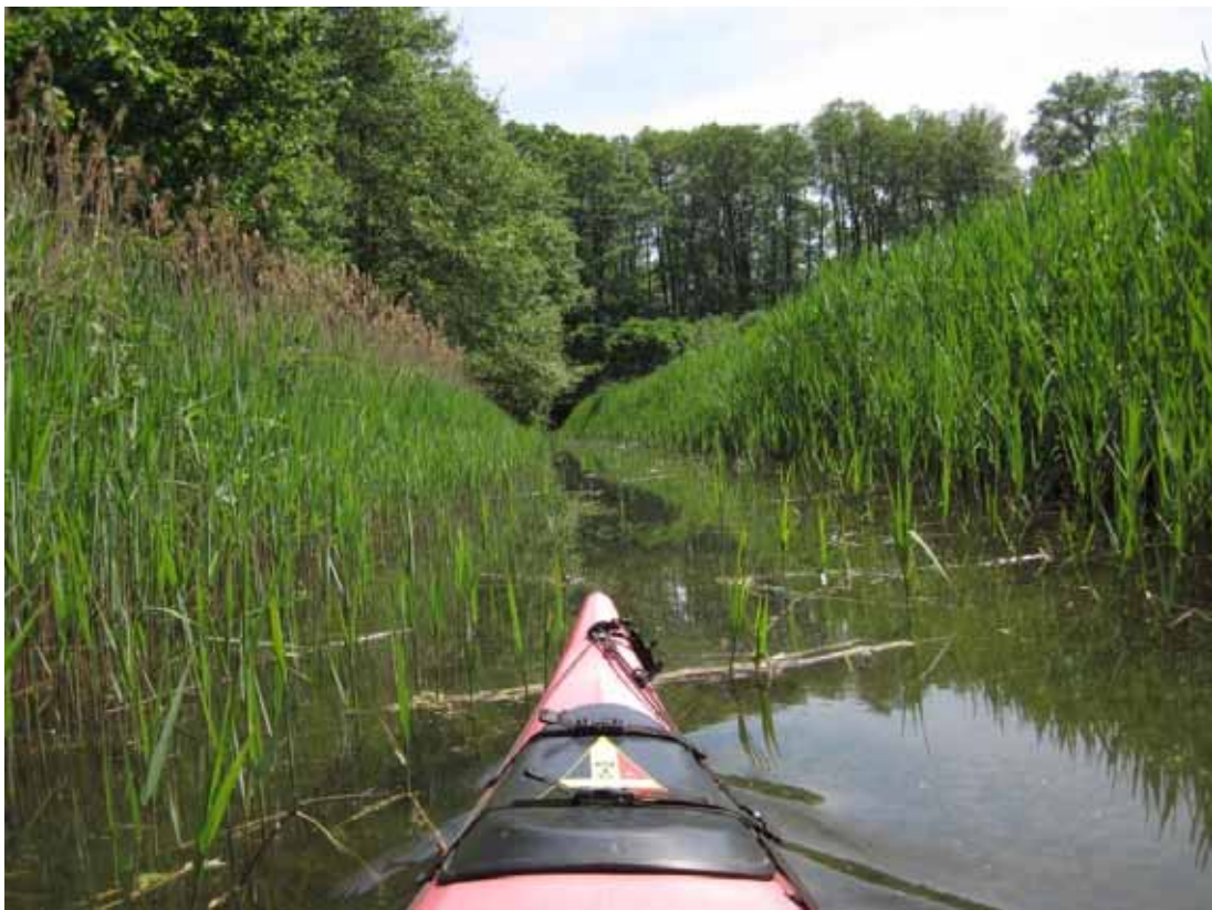
Auf der Schwaanhavel