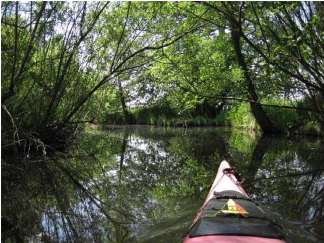
Auf der Schwaanhavel