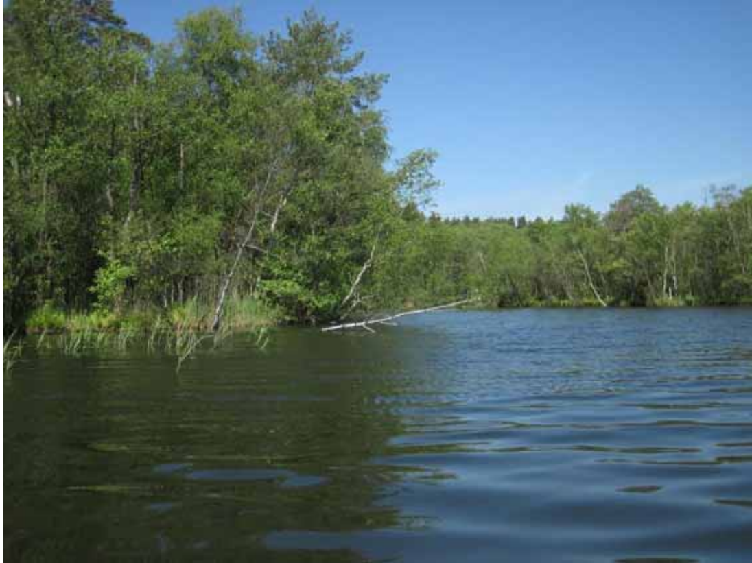
Auf der Alten Fahrt am Nordende des Großen Kotzower Sees