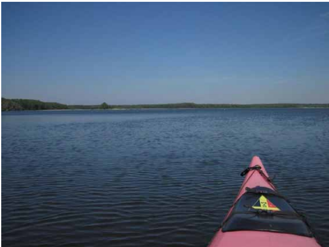
Auf dem Woterfitzsee