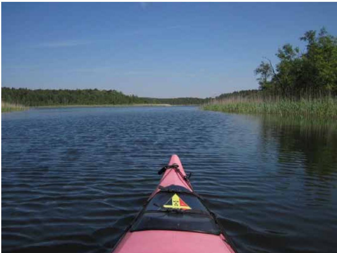
Auf der Alten Fahrt von Granzow zur Bolter Mühle