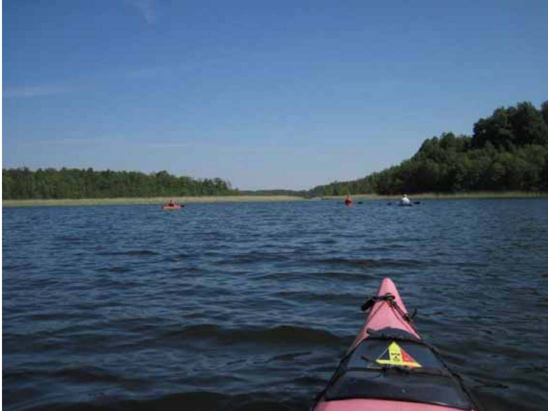
Auf der Alten Fahrt von Granzow zur Bolter Mühle