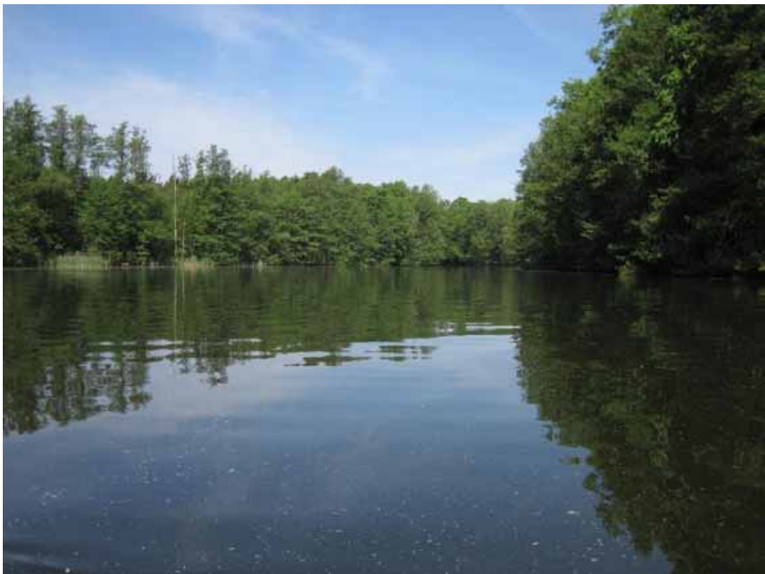
Nordende des Großen Priepertsees