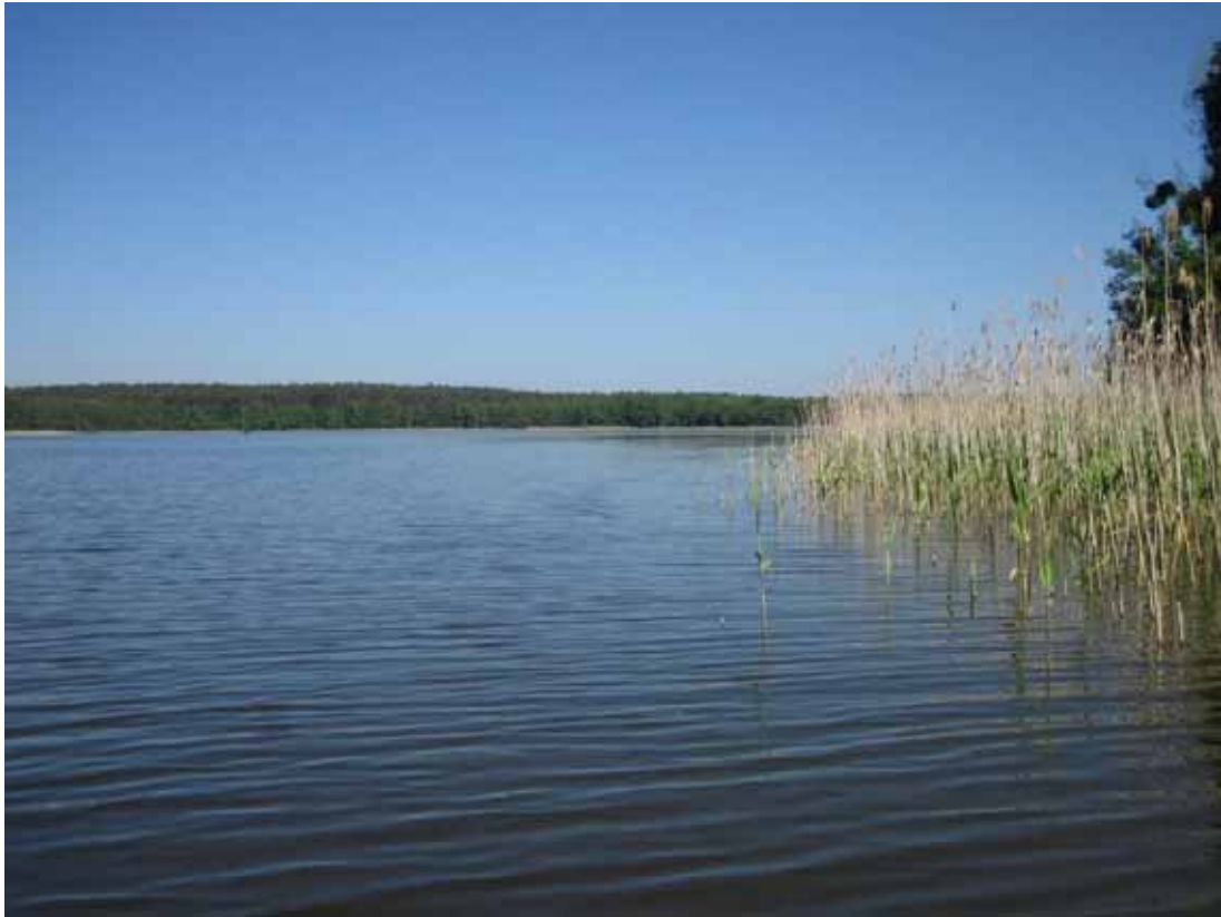
Die Südeinfahrt in die Drosedower Bek