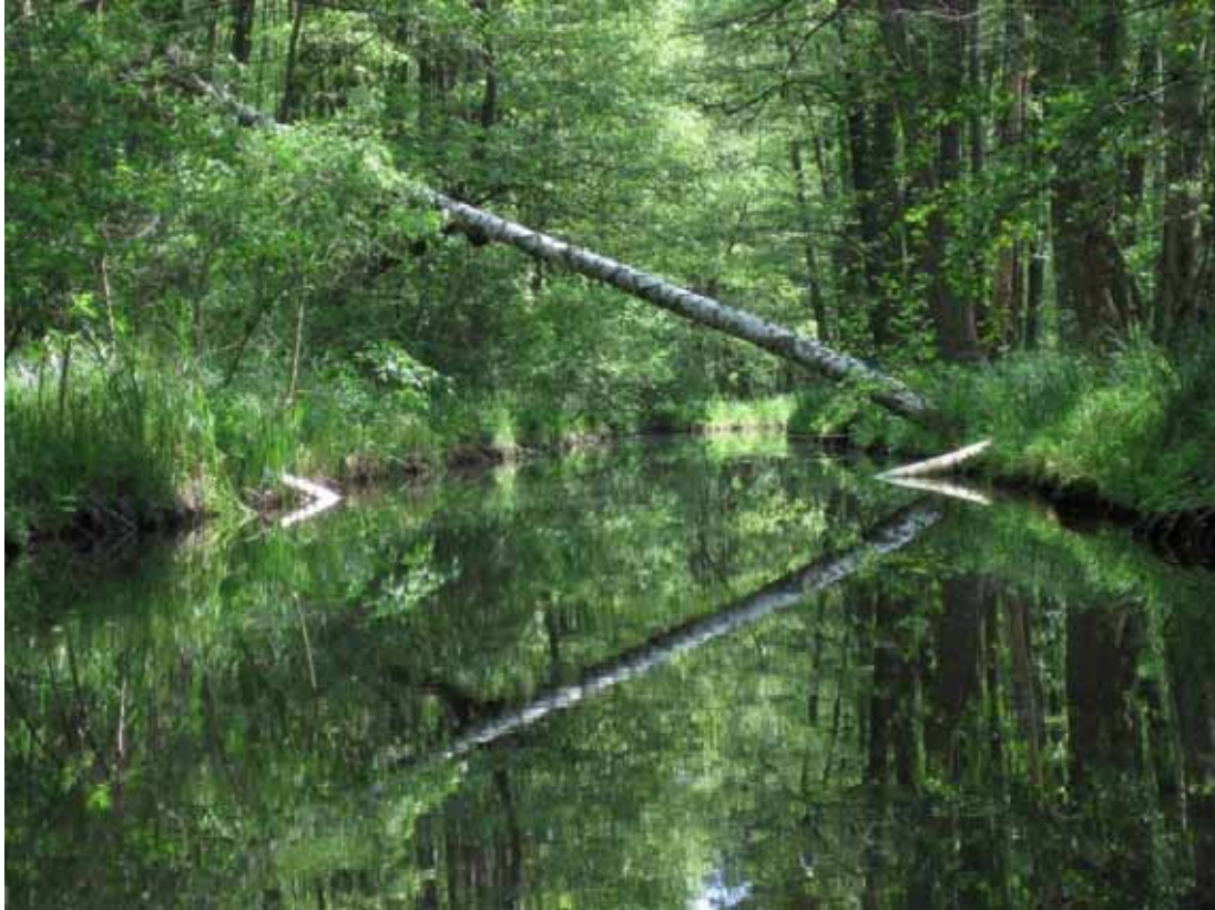
Auf der Schwaanhavel