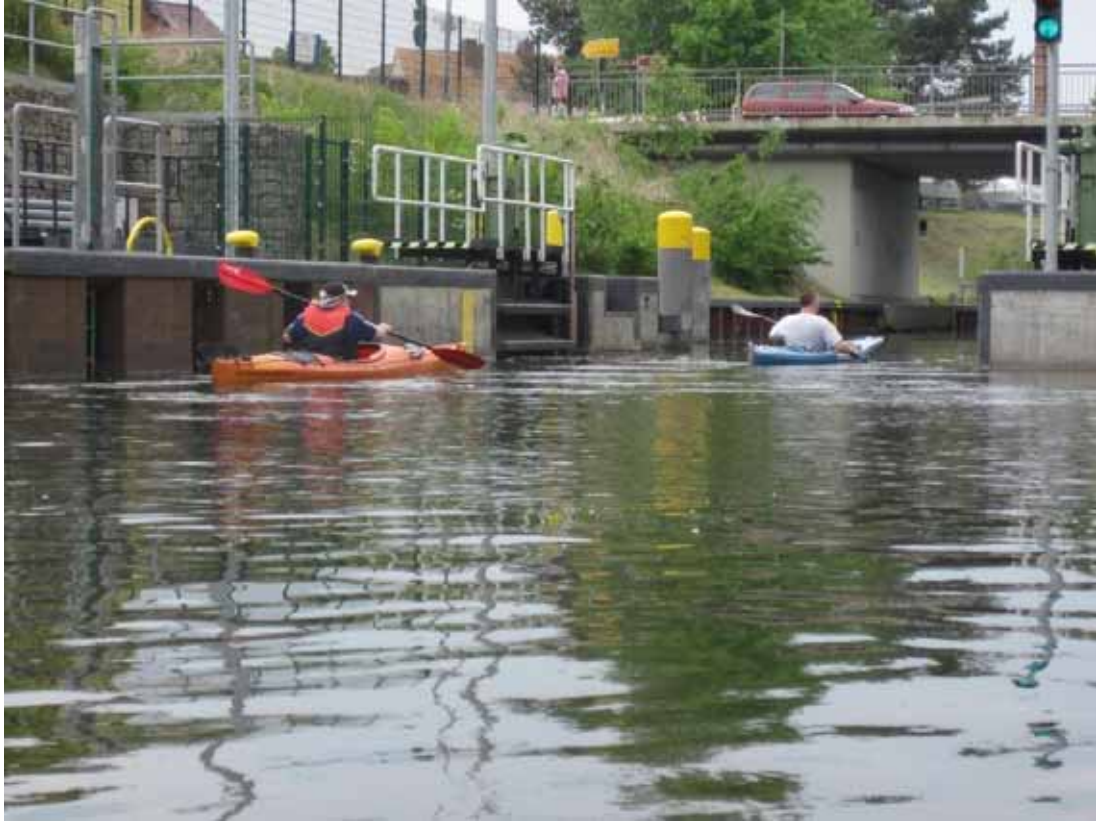
In der Schleuse Fürstenberg