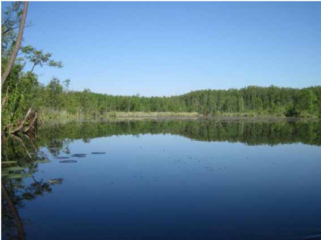
Der Klenzsee bei Wustrow