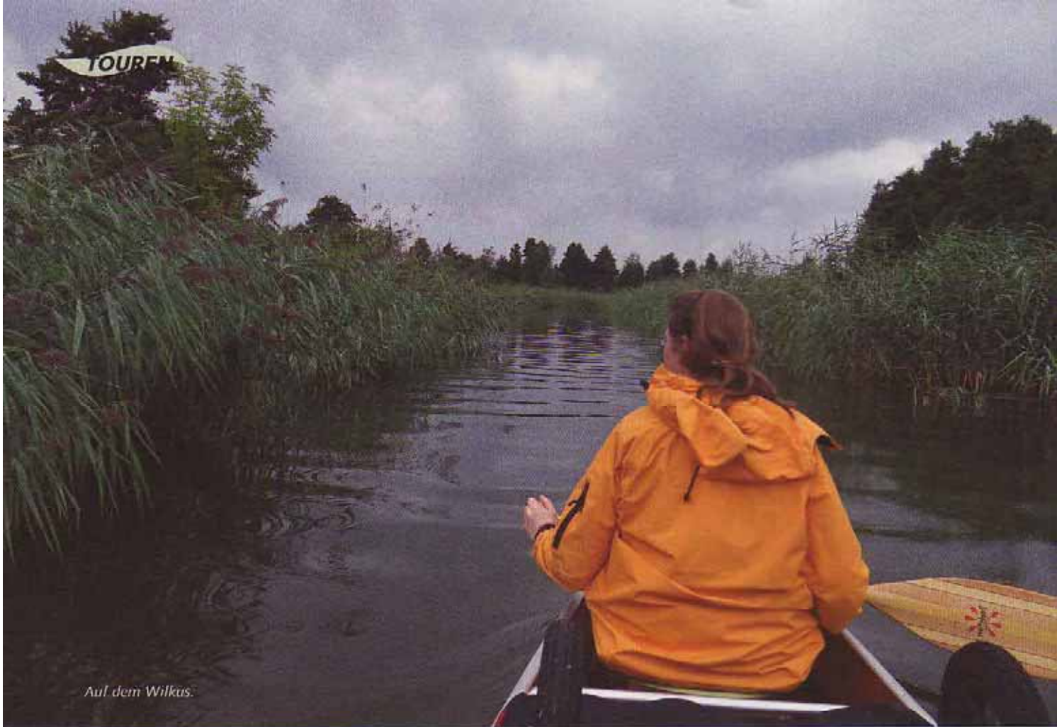
Auf dem Wilkus.