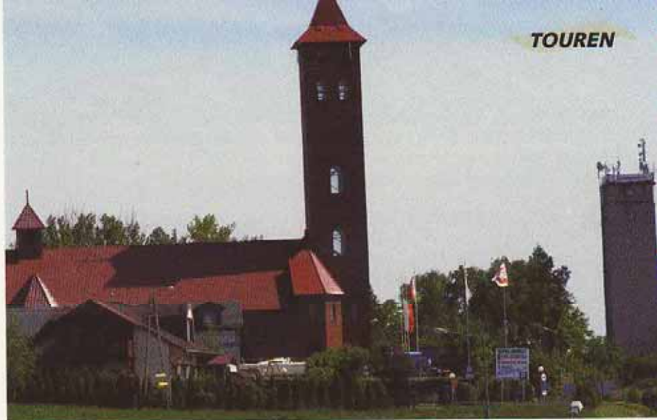
Kirche in Mikolaiki.

doch verwunderlich, so wenig Paddler zu treffen! Als wir die Schleuse verlassen, zieht das nächste Gewitter heran. Wir machen uns auf die Suche nach einem Übernachtungsplatz. Immer näher rücken uns dabei Blitz und Donner. An einer Segleranlage stehen einige Zelte – wir beschließen, das soll so sein und schlagen mit von Kälte schlotternden Knien unser Zelt auf.