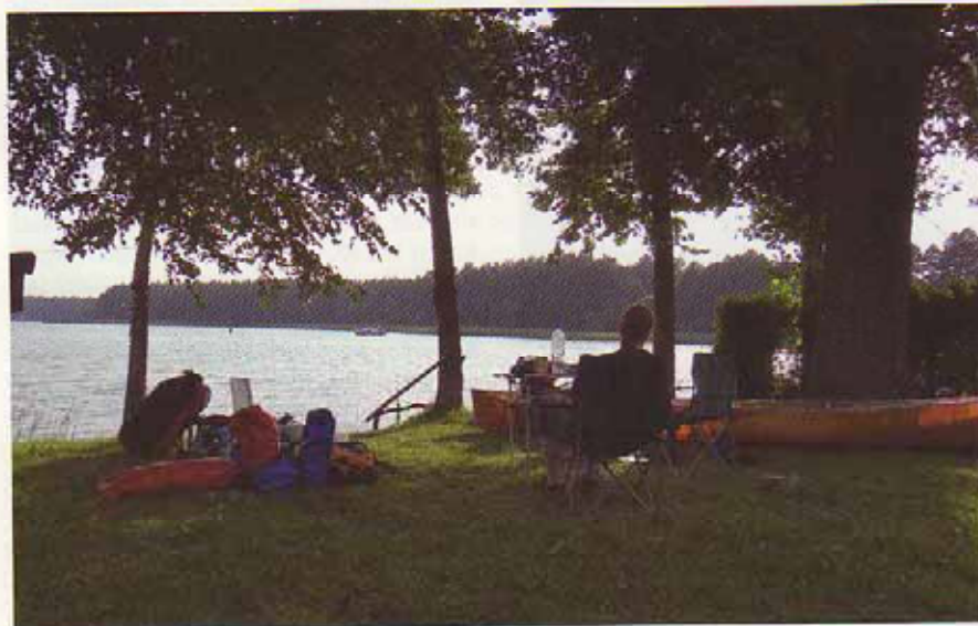
Rastplatz am Jez Jagodne.

In einer Regenpause bauen wir am Morgen ab, werden aber den ganzen Tag von kleinen Gewittern und kräftigen Schauern begleitet. Je nasser wir werden, desto unbeeindruckter setzen wir die Fahrt fort. In Ruciane-Nida müssen wir schleusen. Vorher füllen wir an einem Steg unser Trinkwasser nach – man weiß ja nie, wo man landet. In der Schleuse sind neben uns zwei Polinnen im geliehenen Kajak – ohne Spritzdecke genauso nass wie wir. Auch wenn die Seen voller Segler sind, ist es