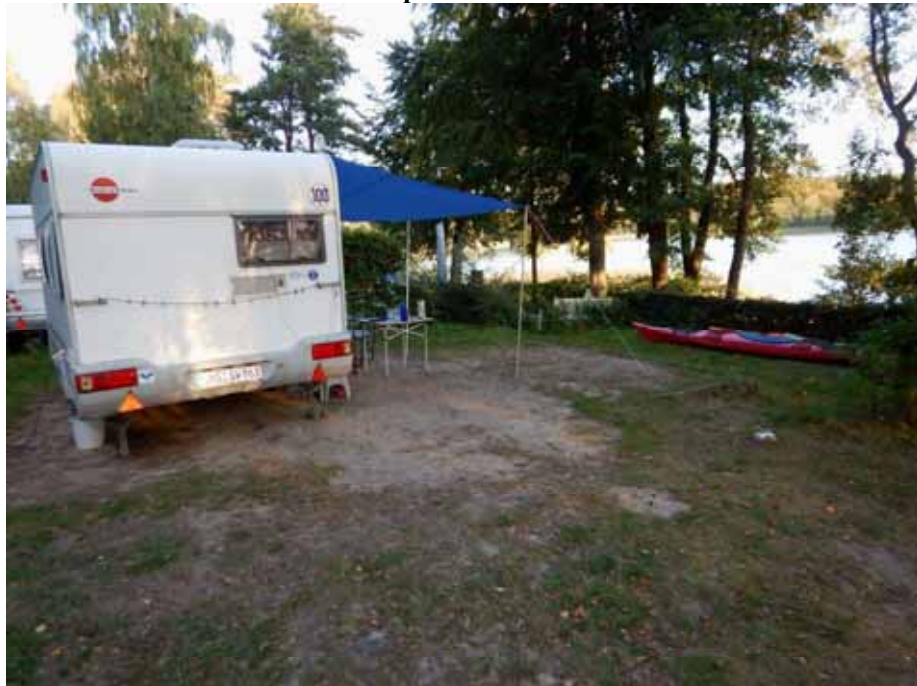
Unser Stellplatz am Gobenowsee

Insgesamt waren es eine schöne Paddeltage, die leider viel zu schnell vorbeigingen. Hier einige Impressionen: